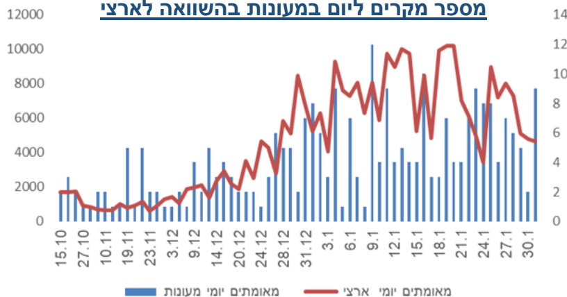
מספר מקרים ליום במעונות בהשוואה לארצי