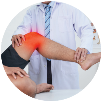
בדיקת רופא במרפאה לקביעת המשך טפול ו/או מועד לביקורת (שבוע 14)