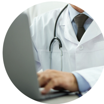
בדיקת רופא במרפאה ובניית תכנית טיפול ייעודית (שבוע 1)